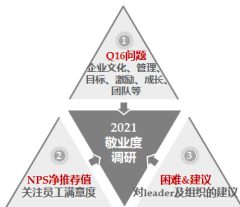
图 12 公司 2021 年度敬业度调研三维度

报告期内，公司治理体系及内部控制规范有效。公司已建立由股东会、董事会、监事会和经营管理层组成的健全有效的组织机构和公司治理架构，形成了权力机构、决策机构、监督机构和经营管理层之间权责明确、运作规范、相互分离与相互制衡的机制，为文化建设提供有效的组织和机制保障。同时，根据法律法规及监管要求，公司已建立以《公司章程》为核心、合法合规且行之有效的公司治理制度体系，包括股东会议事规则、董事会议事规则、监事会议事规则、董事会各专门委员会议事规则、关联交易管理制度、总经理办公会议事规则等配套制度规则，为公司法人治理结构的规范化运行提供制度保障。公司始终将内部控制建设贯穿于经营发展中，强化制度执行，落实监督检查，保障公司健康、稳健发展。