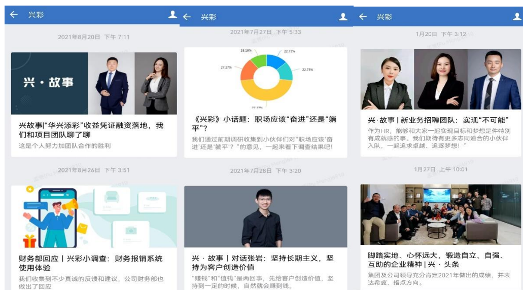
图 6 公司内刊开设栏目

公司积极组织并参加各类文化理念培训及文化建设活动，通过多种途径传播文化理念，营造文化氛围，并以实际行动践行企业价值观。在内部学习层面，公司定期组织新员工培训，为新员工发放员工入职指引与员工手册，将行业文化建设十要素十问宣传册与公司文化宣传册放入公司图书角与企业文化宣传栏，帮助员工尽快了解和学习行业文化、公司文化、职业道德和专业要求，提升员工的专业能力和职业素养。报告期内公司组织 3 次覆盖不同类别员工的团建活动，每月开展员工生日会活动，促进员工融入公司文化。报告期内公司组织全员进行年度敬业度调研，收集员工建议；在公司内刊开设“兴彩小话题”、“兴·故事”、“兴·头条”等栏目，激励员工干事创业，为员工提供交流分享、建言献策的平台。