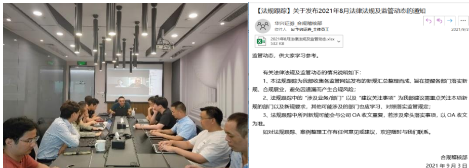
图 5 公司制度文化宣贯

公司不定期组织全体人员参加新《证券法》、声誉风险管理、信息安全、反洗钱、廉洁从业等方面的学习培训，传达监管机构对执业行为的最新要求，提高执业人员对现行政策的理解，引导督促员工践行行业和公司文化理念。一是对新进员工及全体员工进行全面普及性合规、风控、职业道德培训。报告期内，公司面向公司全员共计发送定期法规跟踪、处罚案件汇总 12 次，开展反洗钱、廉洁从业等专项培训 2 次、声誉风险培训 1 次、信息安全培训 1 次。二是针对不同部门进行差别化、深入性合规培训和宣导。评价期内开展面向全体股东的专题培训 1 次，面向业务部门专项合规培训 3 次。三是密切跟踪资本市场动态，结合公司经营情况，挑选典型案例及风险事件，有针对性制作推送宣导邮件 23 次。