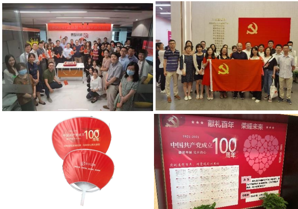
图 2 公司七一党建活动及相关宣传品

坚持在助力疫情防控中敢于担当勇于作为，按照“确保安全、感恩向善、稳定业务”的工作原则，凝心聚力持续抗击新冠疫情。在疫情防控的特殊时期，公司统筹推进疫情防控与业务开展，两手抓，两不误，充分发挥证券公司的专业价值，围绕服务新经济的战略定位，积极开展科技企业、绿色环保企业的投资银行服务，全力支持实体经济快速恢复发展。作为资本市场链条中的重要一环，公司严格落实属地疫情防控要求，建立疫情工作联络群，及时制定新冠疫情防控应对预案和防控措施，确保员工健康安全，保障交易、运营等各业务正常开展，努力维护了资本市场的稳定运行。