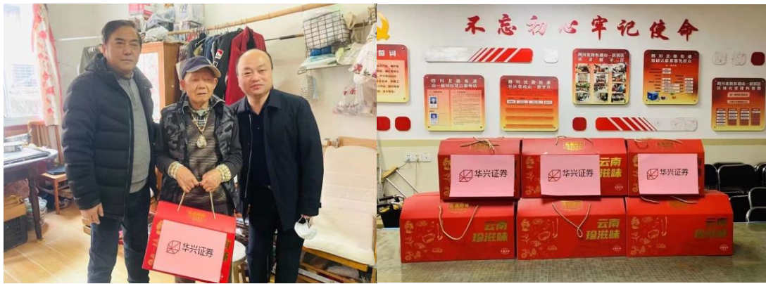
图 3 公司消费扶贫活动

来的不利影响，报告期内，公司主动开展消费扶贫活动，从云南省文山州采购“珍滋味”年货礼盒，并定向捐赠至上海市虹口区四川北路街道山一社区困难家庭，将精准扶贫与社区帮扶有机结合。参加证券业协会组织的“善行者”徒步公益活动，累计捐赠金额 2 万元；在公司内部组织华兴幸福集市，为河南受灾员工献温暖等活动，以实际行动践行社会主义核心价值观。