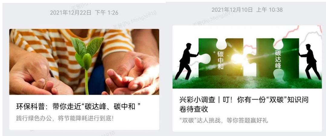
图 4 公司对“双碳”知识的宣传

等方式降低排放，交易闲置物品，实现自身运营活动的“碳中和”；二是在投融资活动方面不断拓宽绿色融资渠道、完善绿色投资管理体系、加强绿色金融研究与创新、加大碳金融服务创新等方面担当作为，积极推动中国经济发展绿色可持续转型。例如围绕碳汇或碳捕集利用与封存等先进负碳技术，开展对应权益产品的设计研发，探索碳中和相关衍生品。