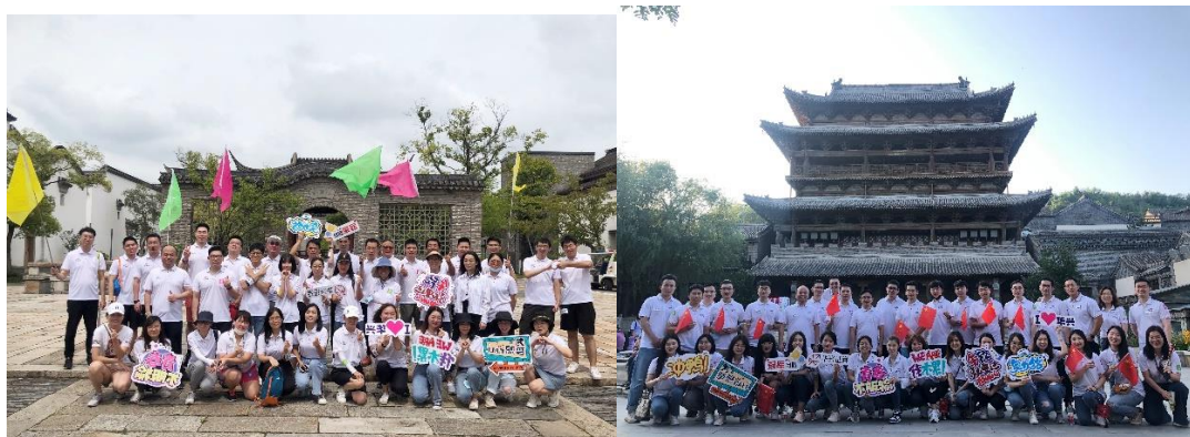
图 8 公司团建活动