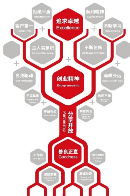
图 1 公司文化价值观

在实施层面,在公司全体员工中大力弘扬“善良正直、分享开放、创业精神、追求卓越”的企业文化,其主要内涵一是坚守道德指南针规范,善良正直是文化基石;二是鼓励分享开放、平等尊重,相信集体的力量;三是倡导主人翁精神,自我驱动、不断创新,着眼长远发展;四是争做专业翘楚,追求卓越,坚持契约精神,为社会创