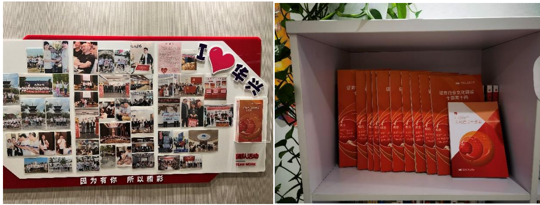
图 7 行业文化与企业文化宣传栏