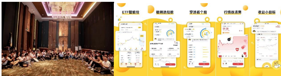
图 11 公司创新业务团队与研发 APP

不断提升用户体验。从客户视角出发，坚持打造一款智能化覆盖用户理财投前、投中、投后完整生命周期服务的产品，以价值投资理念贯穿始终，为零售客户提供线上、线下一体化服务和卓越的投资交易体验。